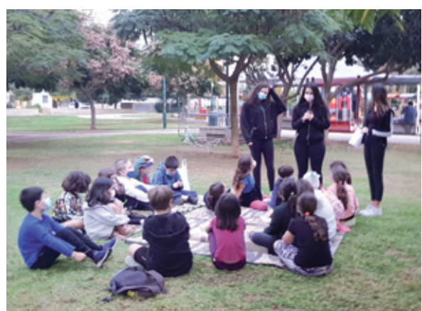
פעילות חווייתית ערכית בפארקים השונים לילדי העיר במהלך השנה