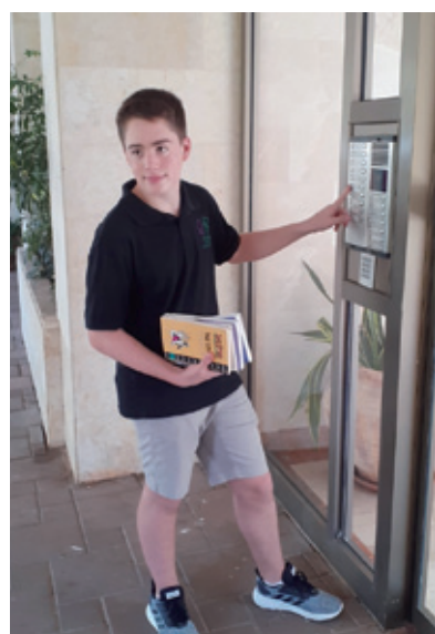
מתן מענה לאוכלוסיות נזקקות בימי הסגר