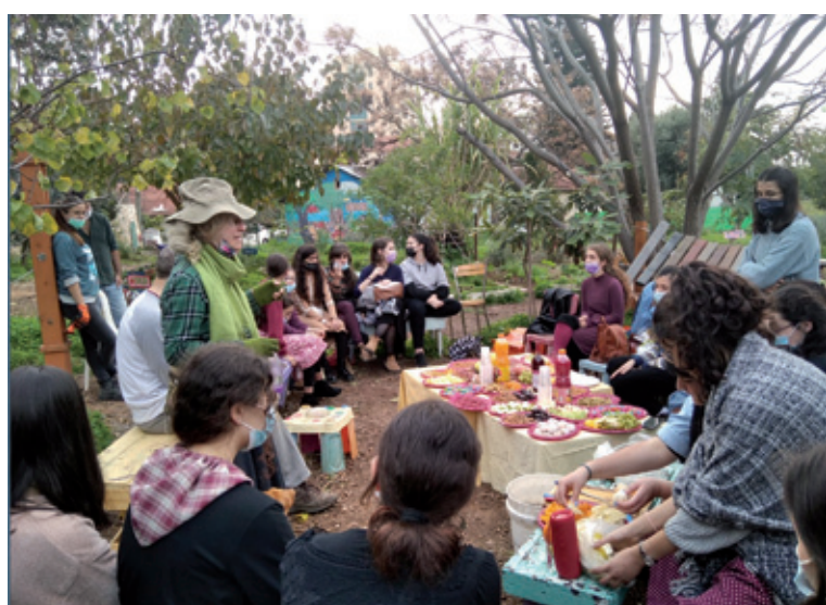
התנדבות לאורך השנה בגינה הקהילתית בעיר