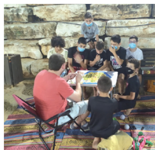
פעילות "ציפורי לילה" בפארקים העירוניים לאורך כל השנה!