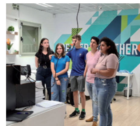
זכייה בתחרות יחידת נוער מצטיינת ארצית לשנת 2020