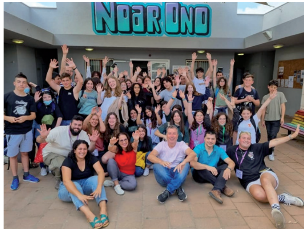
האקטון עירוני בנושא "פיתוח פתרון חברתי" למען אנשים עם מוגבלויות

לאורך השנה בני הנוער השתתפו במגוון פרויקטים ייחודיים. הפעילויות עסקו בנושאי פנאי, העשרה, התנדבות ומעורבות חברתית