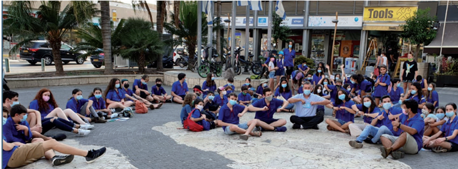
■ קן קריית אוננו, רח' קפלן 56 ■ שלוחת הקן, רח' הרקפת 8